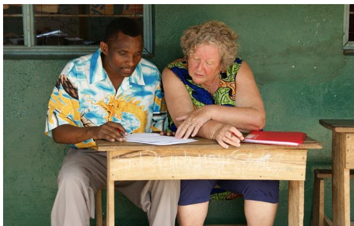
Figuur 1 het WWF aanvraagformulier heb ik samen met de wiskundeleraar ingevuld

Eind 2015 heb ik een aanvraag gedaan voor wiskundeboeken voor de klassen 6, 7 en 8 van de Mahuruni Primary School in Lunga Lungu, een stad in het district Kwale, vlak bij de grens met Tanzania.