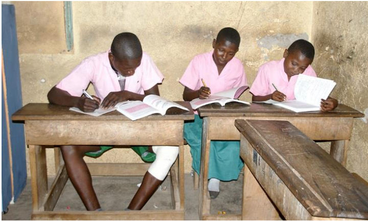
Figuur 3 Leerlingen aan het werk

leerling het best op zijn plaats is voor een vervolgopleiding. In Kenia bepaalt de overheid dat. Soms worden leerlingen ver van huis geplaatst. De meeste middelbare scholen zijn boarding schools (kostscholen) en de kosten van het vervolgonderwijs hangen af van de totale scores op de belangrijkste vakken.