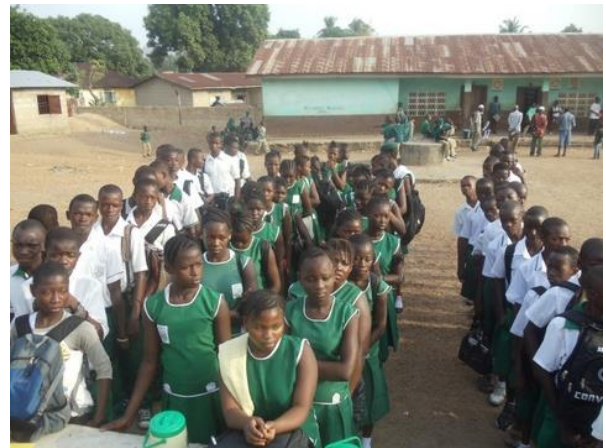
Ochtendgebed voordat de lessen beginnen