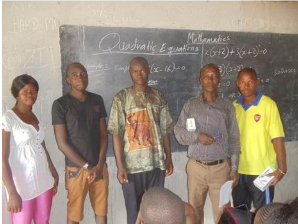
Stafleden en leden van WIADP

kundemateriaal verlicht de inspanning van de docenten; zij ondervonden een grote belasting door het gebrek aan leerboeken en materialen. De leerlingen kunnen het materiaal op school gebruiken; aan het einde van de schooldag geven ze het terug aan de docenten. Of ze kunnen het lenen om thuis te gebruiken. Men hoopt zo de motivatie voor het vak te vergroten zowel bij de docenten als bij de leerlingen; en de leerlingen een grotere kans te geven om te slagen voor het examen dat nodig is voor een hogere opleiding.