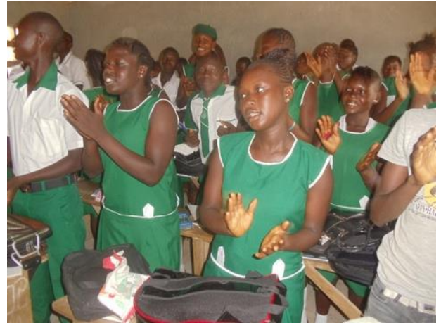
Applaus voor het nieuwe materiaal